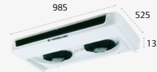
ES200 ULTRA SLIM