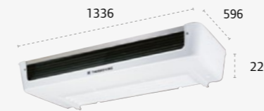
ES500 Ultra Slim