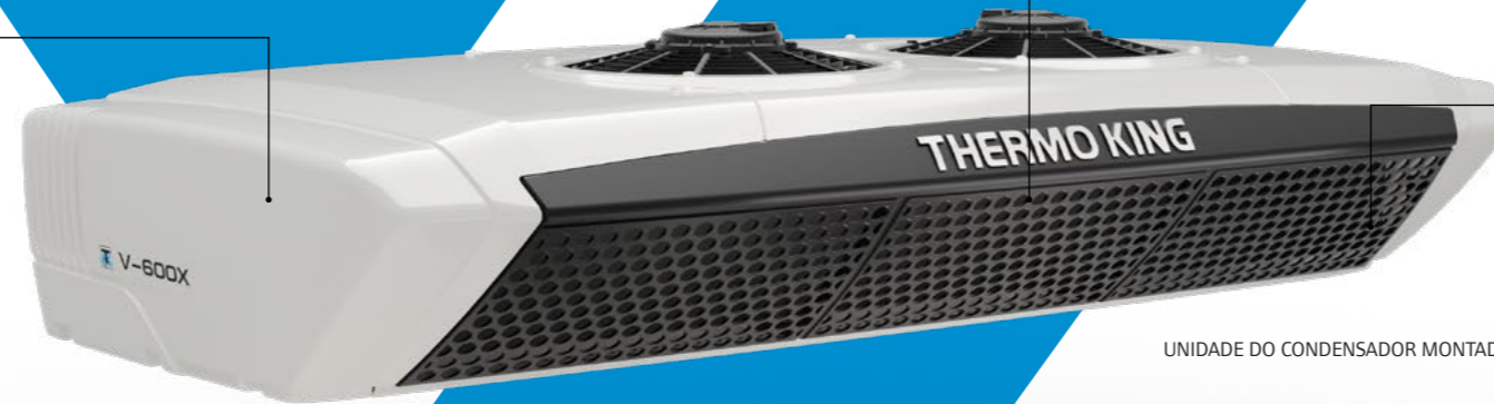
UNIDADE DO CONDENSADOR MONTADA NA EXTREMIDADE