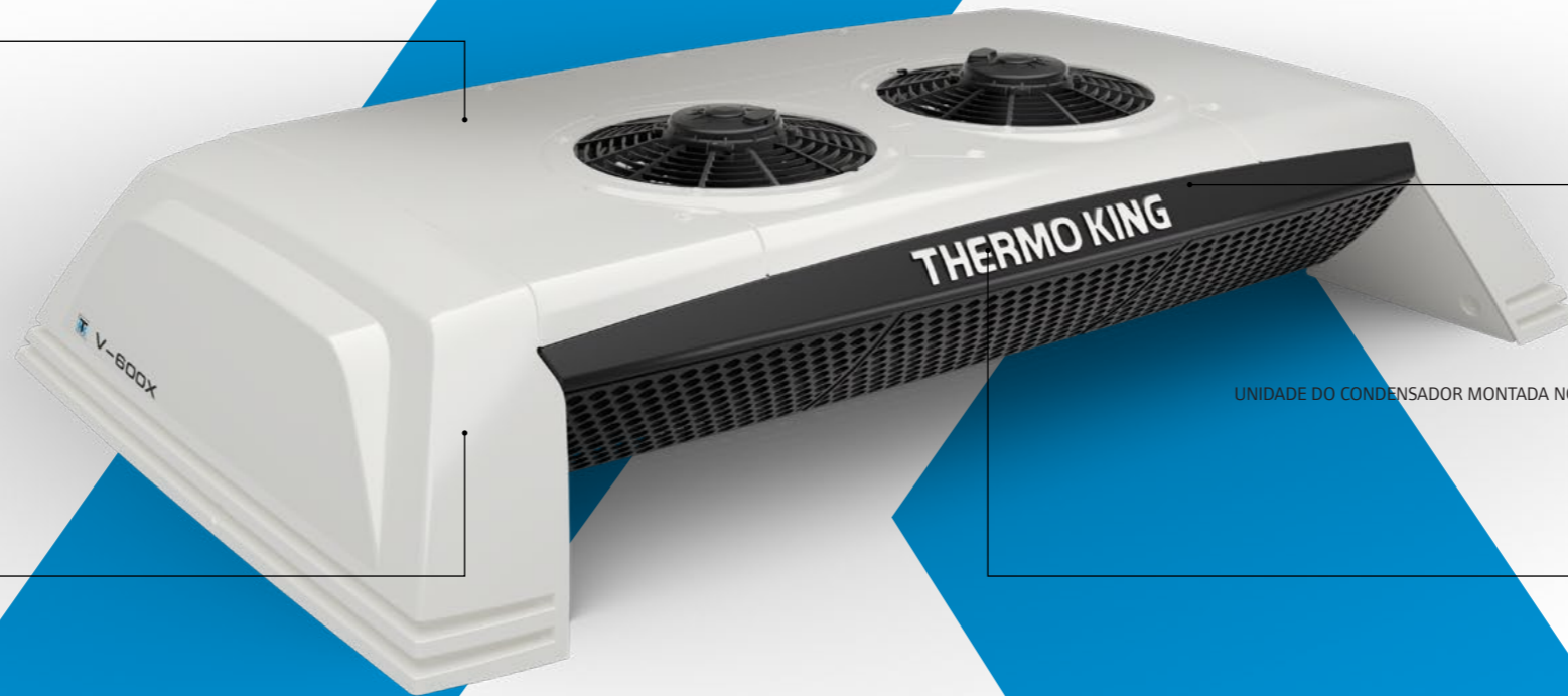
UNIDADE DO CONDENSADOR MONTADA NO TETO