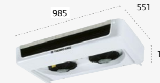
ES300/ ES300 MAX ULTRA SLIM