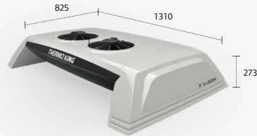
UNIDADE MONTADA NO TETO V400X/500X/600X