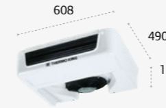
ES100 ULTRA SLIM