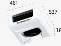
ES100N* ULTRA SLIM