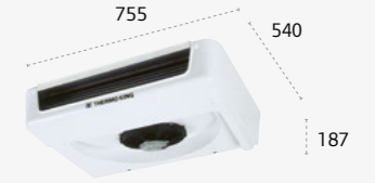
ES150 MAX ULTRA SLIM